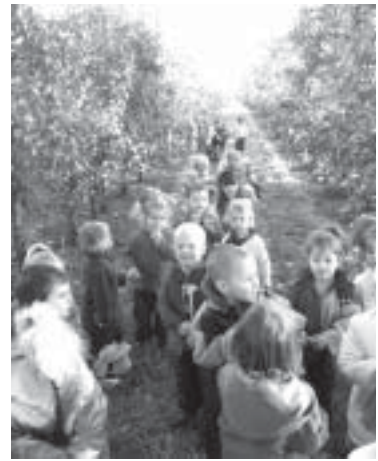
Visite des vergers