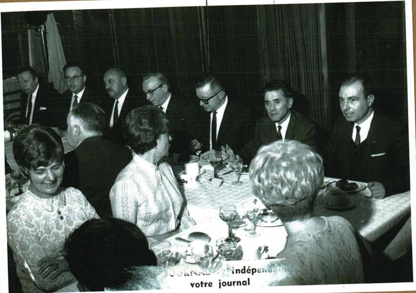
Soirée d'un souper-débat organisée par une Association d'enseignants en 1969