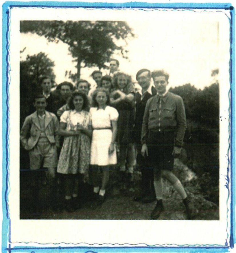
à la "Roche aux Faucons" à Billff.